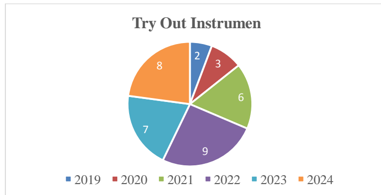
Gambar 4.3 Responden Try Out Instrumen

Analisis statistik deskriptif dilakukan untuk mengetahui kecenderungan data pada masing-masing variabel penelitian, yaitu adaptasi, komunikasi dan pola belajar